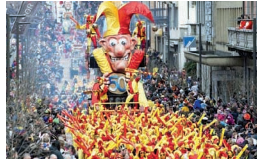
Die fünfte Jahreszeit

Nun könnte man im Zusammenspiel mit anderen Einflüsse meinen, dass ganz dem Wassermann entsprechend dem Fortschritt eigentlich nichts im Wege stünde. Doch dem wird nicht so sein – im Gegenteil: Der Eintritt der Sonne in den Wassermann steht im Sog der totalen Mondfinsternis vom 21. Januar 2019. Mit Saturn, Pluto und Merkur im Steinbock am absteigenden Mondknoten steht die Vergangenheit in all ihren Facetten im Vordergrund. Welche Strukturen, Systeme und Erfahrungen gilt es den neuen Realitäten anzupassen und welche Erfahrungen können für die Gestaltung der Zukunft genutzt werden, so lautet die Frage. Gleichzeitig laden der Mond am aufsteigenden Mondknoten im Krebs und auch Neptun in den Fischen dazu ein, sich auf unsere Gefühle und all das, was uns Geborgenheit schenkt, zu besinnen. Zusammenfassend können wir auch sagen, dass es um den Mut geht, harte Regeln und Gesetze zugunsten von Mitgefühl und Liebe loszulassen.